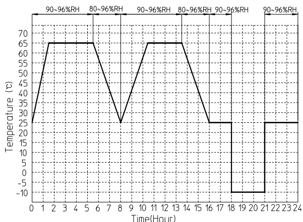
図1. 温湿度Shock Test/サイクル Fig 1. Temp and Humidity Cycle